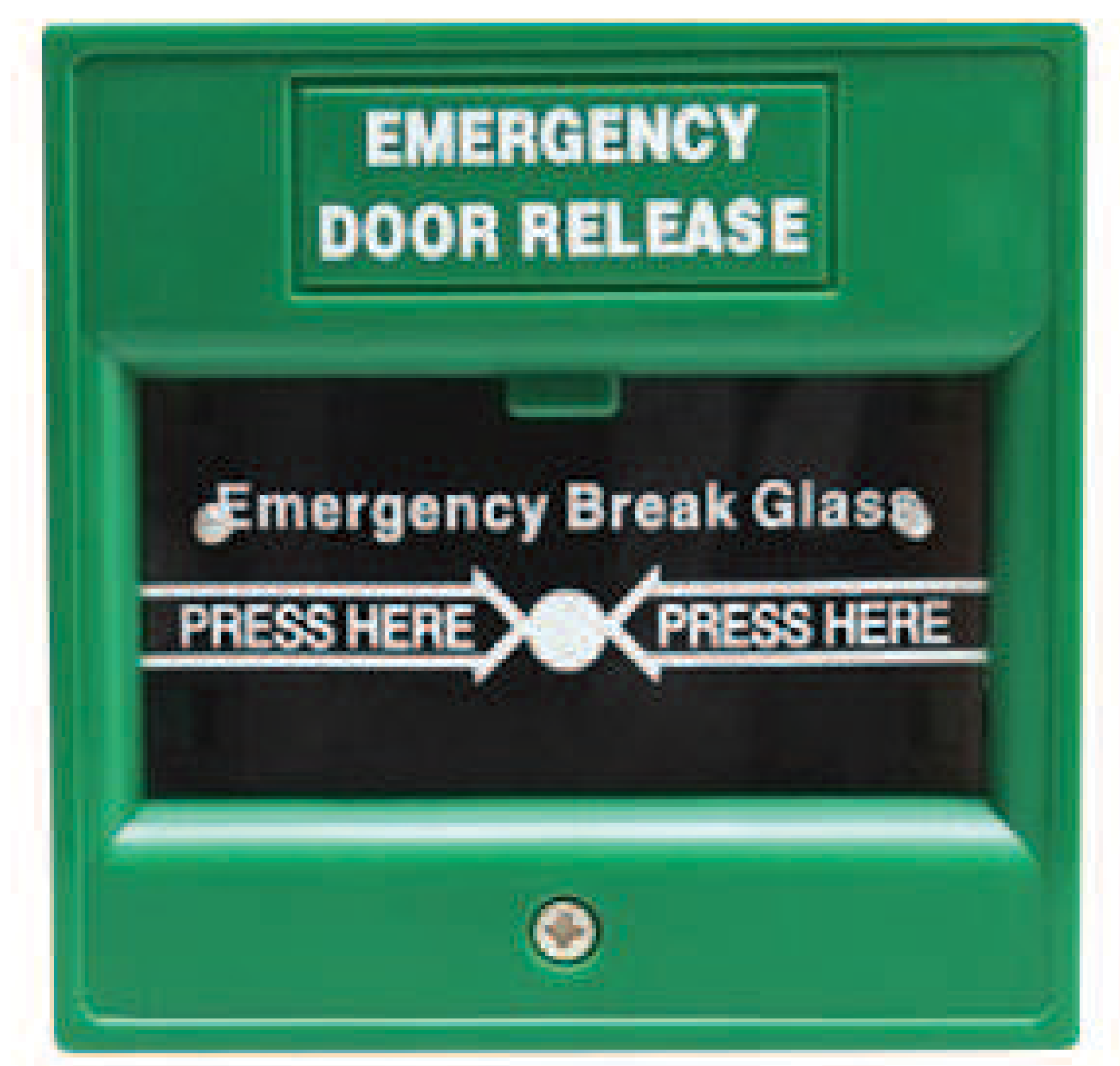
BREAK GLASS DOOR RELEASE เปิดประตูฉุกเฉิน